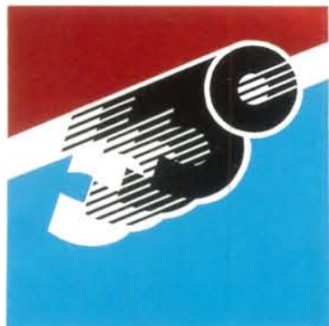
中原大學卅週年校慶紀念 CHUNG YUAN CHRISTIAN UNIVERSITY 30th ANNIVERSARY CELEBRATION 1985-1988